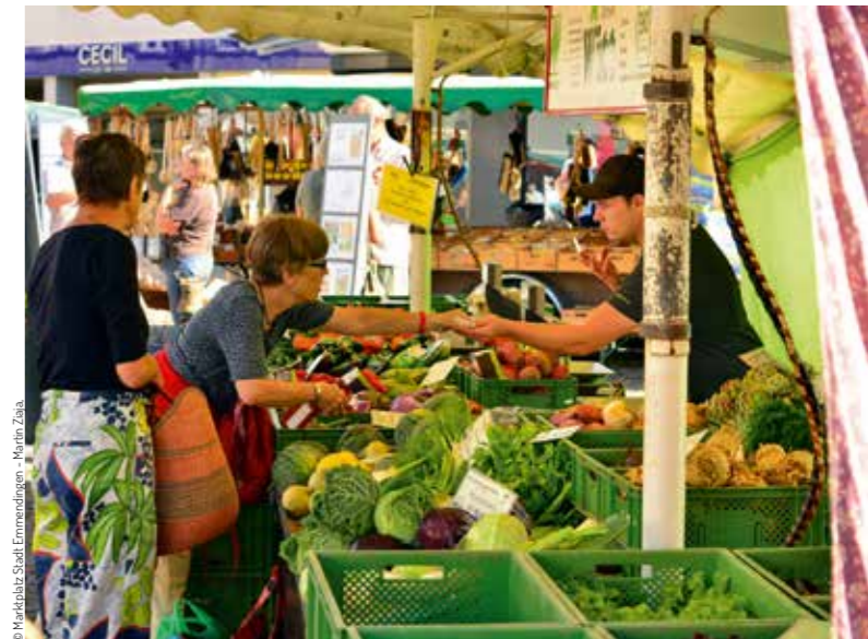
© Marktplatz Stadt Emmendingen - Martin Ziaja.

Rund um die große Kreisstadt findet man viele Weingüter und Straußen die zur Einkehr einladen. Einkaufen auf den Wochenmärkten oder einfach durch die Stadt bummeln - in den Straßen und Gässchen gibt es viel zu entdecken.