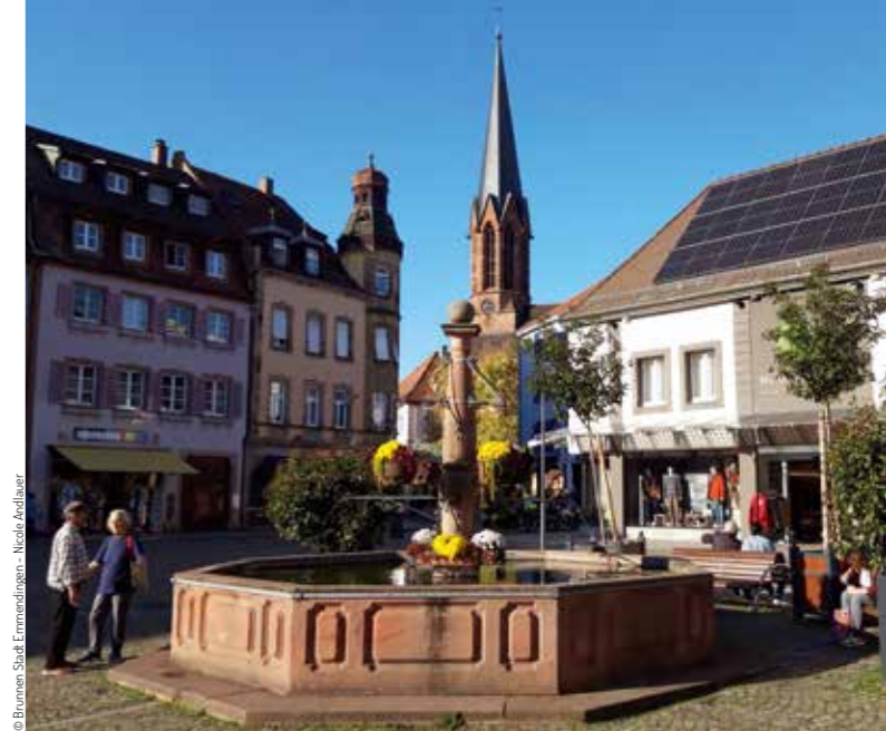
© Brunnen Stadt Emmendingen - Nicole Andlauer.

Rund um die große Kreisstadt findet man viele Weingüter und Straußen die zur Einkehr einladen. Einkaufen auf den Wochenmärkten oder einfach durch die Stadt bummeln - in den Straßen und Gässchen gibt es viel zu entdecken.