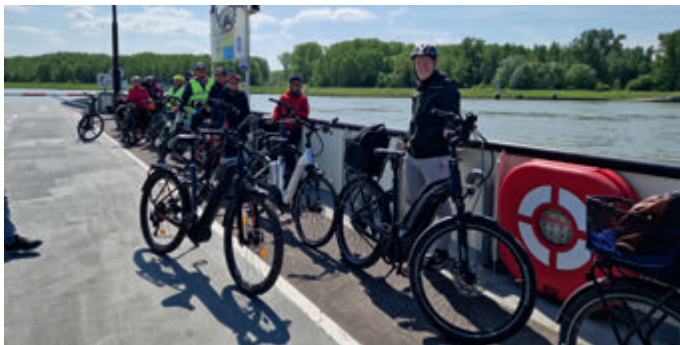
© Peter Schönstein - Bar 24

„Heimat erfahren“. Einfach mal die schönsten Ecken unserer Region ganz neu entdecken. Und gute Touren-Tipps gibt es immer gratis dazu. Versprochen. www.rad-schulz.de Di bis Fr von 9:00 – 18:00 Uhr, Samstag von 09:00 – 13:00 Uhr